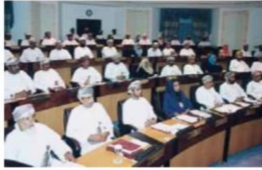
احء اجتماعات مجلس الدولة